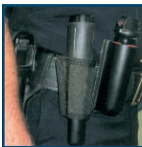
Fondina balistica (inclusa) che si monta facilmente sulla cintura o sulla macchina di ordinanza.